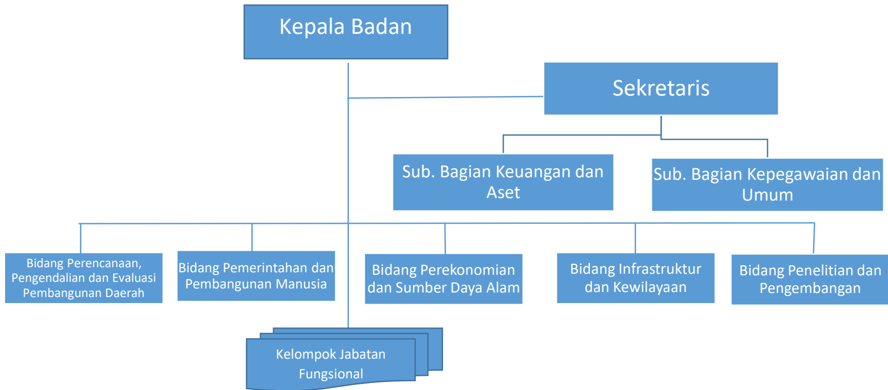
Struktur Organisasi Badan Perencanaan Pembangunan Daerah, Penelitian Dan Pengembangan Kabupaten Buol